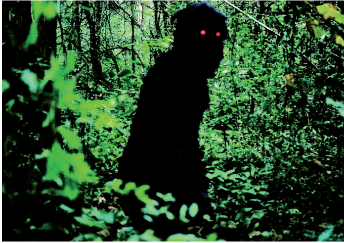
Uncle Boome who can recall his past lives. Apichatpong Weerasethakul.